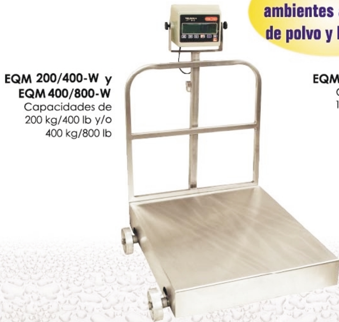
EQM 200/400-W y EQM 400/800-W Capacidades de 200 kg/400 lb y/o 400 kg/800 lb