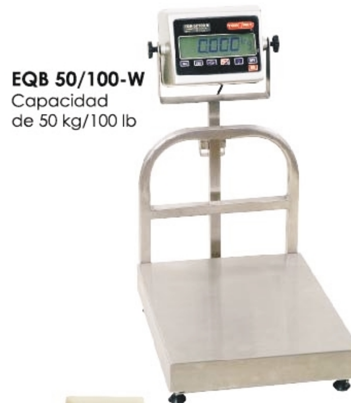
EQB 50/100-W Capacidad de 50 kg/100 lb