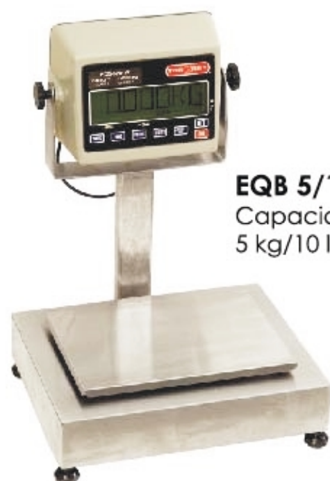
EQB 5/10-W Capacidad de 5 kg/10 lb