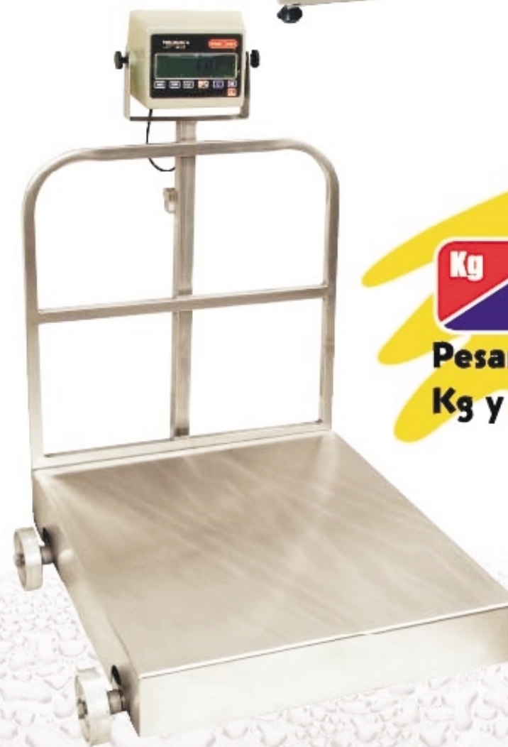
EQM 1000/2000-W Capacidad de 1000 kg/2000 lb

Ideales para esos ambientes adversos de polvo y humedad