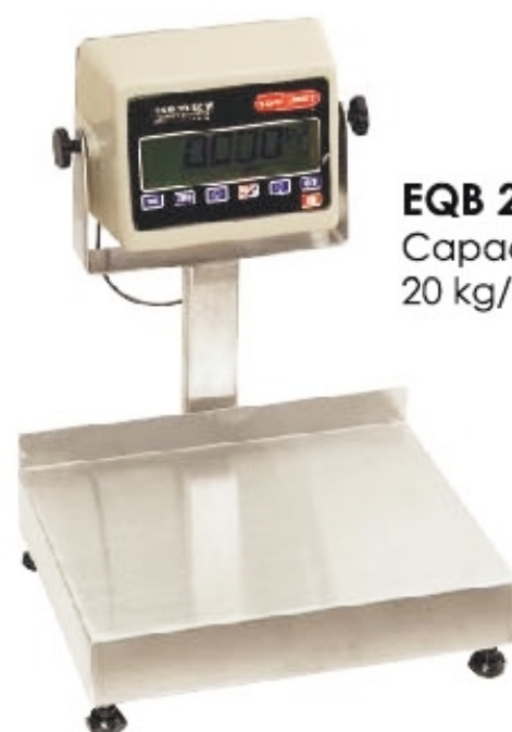
EQB 20/40-W Capacidad de 20 kg/40 lb